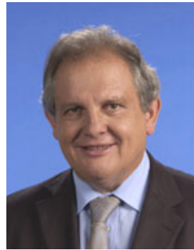
Jean-Yves LE DÉAUT, Député de Meurthe-et-Moselle